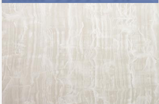
GL6020 プランクマーブル