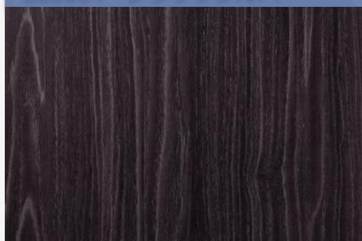
GL5084 ブラックシルバー